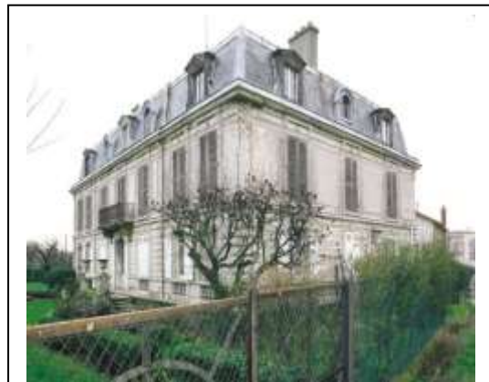
L'ancienne maison Godart

Antoine-Joseph Godart (1811-1885) et son fils Édouard-Nicolas sont tous deux négociants et distillateurs d'une des spécialités de la Vallée, à savoir une variété de liqueur de cerises dites de Montmorency . La publicité de l'époque de la distillerie