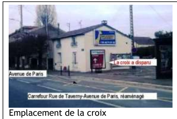
Emplacement de la croix

Pisleu est une contraction de puits et de loup . Cette croix est située à l'intersection de la Rue de Taverny et Rue de Paris . Probablement il y a eu un puits. Ce puits, souvent à sec, a un débit très faible. Il est aisé de deviner le sobriquet des habitants : puits qui pisse comme un loup . Loup est prononcé leu , comme Saint-Loup au lieu de Saint-Leu .