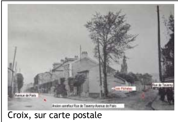
Croix, sur carte postale