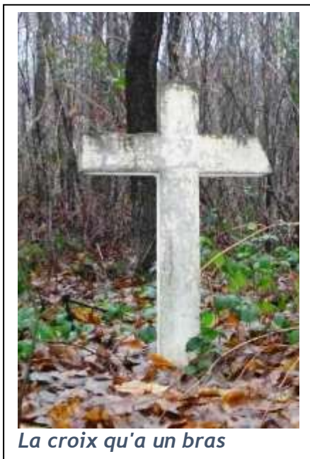
La croix qu'a un bras

Elle se situe au niveau du chemin des Volerands . Les Volerands dérive du latin vallis qui se traduit par val , vaux , vallée en français. Il désigne une zone entre deux collines. Volerands est la contraction de Vaux et Laurent dit bien que ces endroits sont occupés par Laurent . La croix de Volerands est placée sur les terres de Laurent . On lui a attribué plusieurs noms. La croix qu'a qu'un bras parce qu'elle a eu un bras cassé, ou la croix du Moulin . Le lieu-dit la Cote du Moulin marque la séparation entre les paroisses de Taverny et de Bessancourt en 1551. Elle est aussi appelée la croix la borne à sonnette . Cette croix, plantée à cet endroit, marque la limite des domaines de l'abbaye du Val et de Maubuisson. Pourquoi sonnette ? Lorsque les cloches des deux abbayes sonnent à toute volée, leur carillon serait entendu des deux monastères.